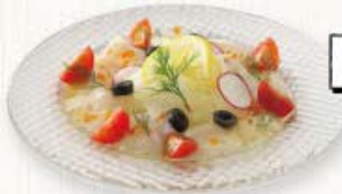
ホタテ貝柱の カルパッチョ