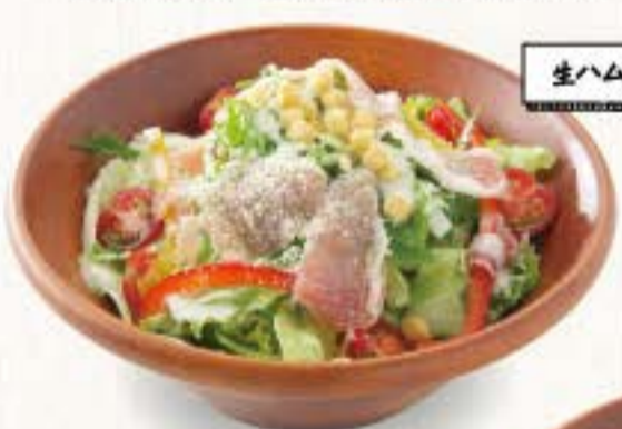
生ハムのシーザーサラダ