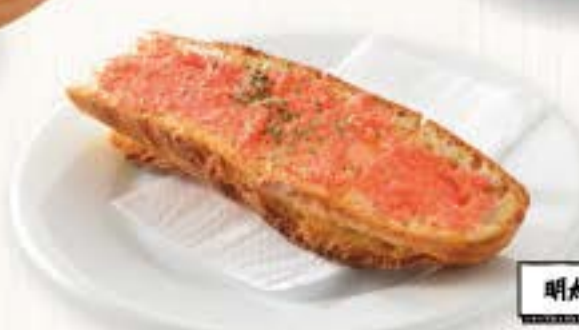
明太バタートースト