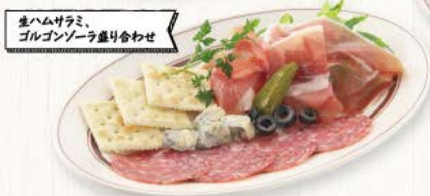
生ハムサラミ、 ゴルゴンゾーラ盛り合わせ