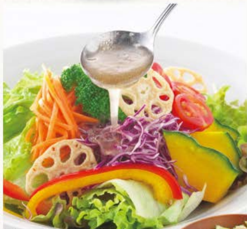
彩り野菜の和風サラダ