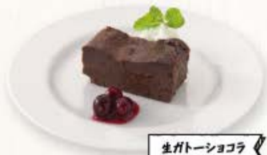
生ガトーショコラ