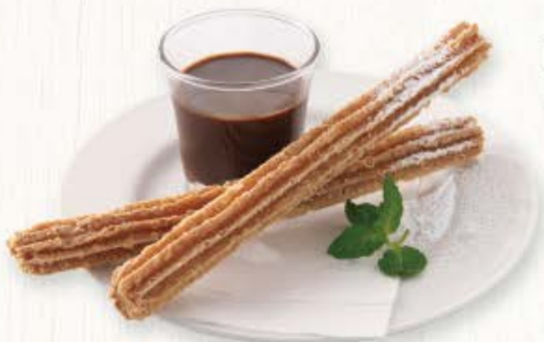
シナモン風味チュロス