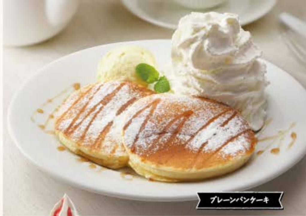
プレーンパンケーキ