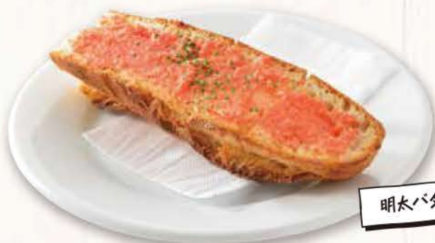
明太バタートースト