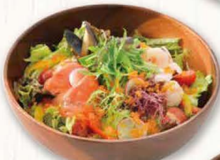
海の幸の シチリア風サラダ