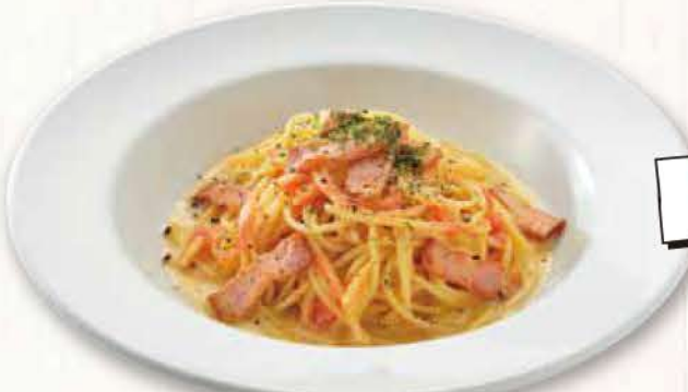
おすすめ 12 濃厚明太子 カルボナーラ

明太子をたっぷり使い、 より濃厚に仕上げたカルボナーラ。 しっかり食べたいときにおすすめです。