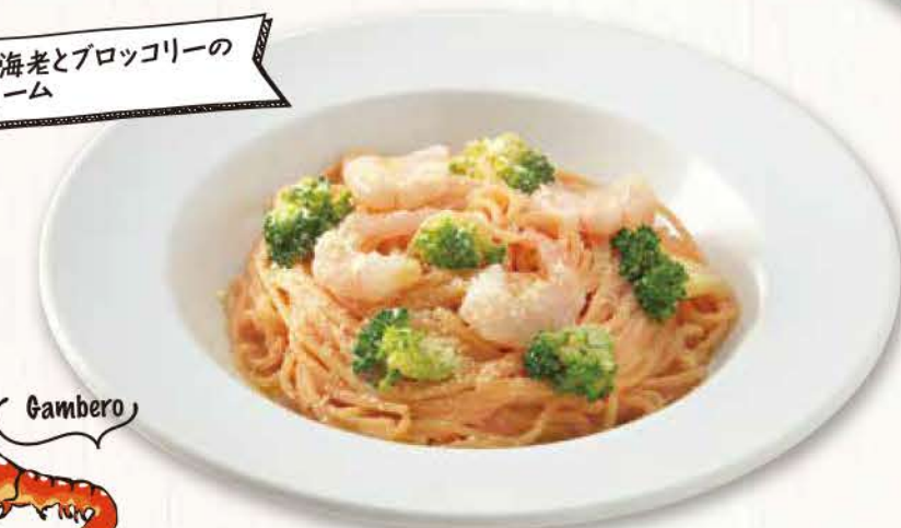
10 ぶりぶり海老とブロッコリーの 明太クリーム