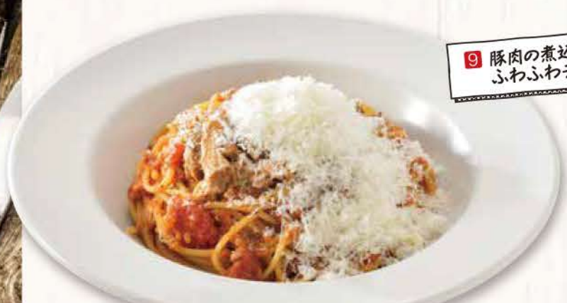
9 豚肉の煮込み ふわふわチーズのせ