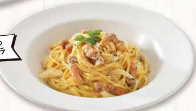
18 自家製パンチェッタの ローマ風カルボナーラ