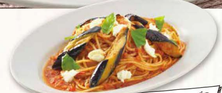
3 茄子とモッツアレラチーズの トマトソース