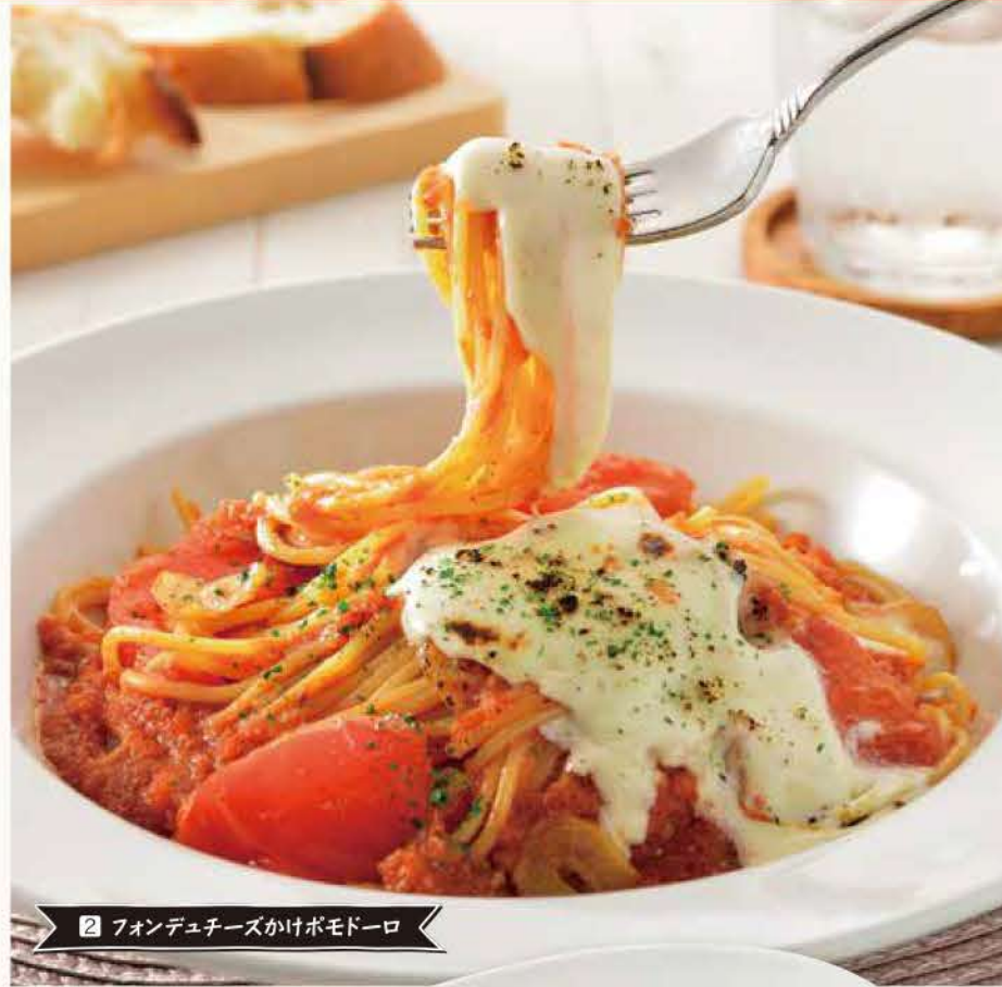
2 フォンデュチーズかけボモドーロ