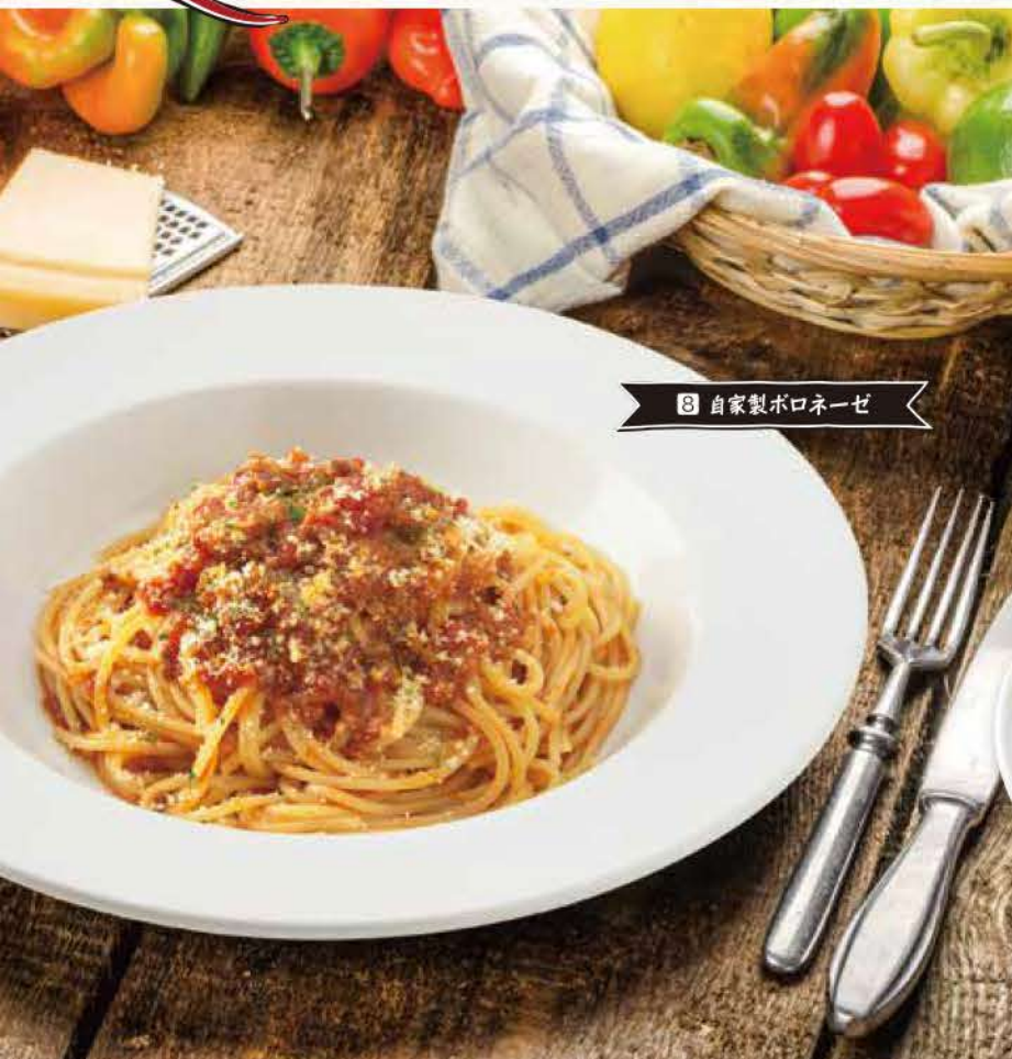
8 自家製ボロネーゼ