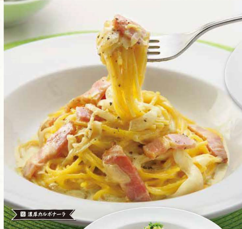
12 濃厚カルボナーラ