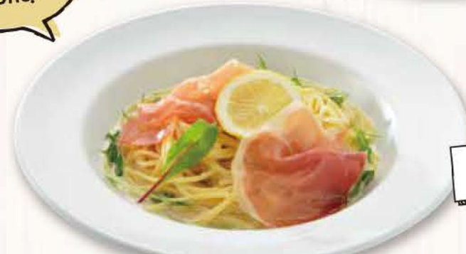
14 生ハム レモンクリーム