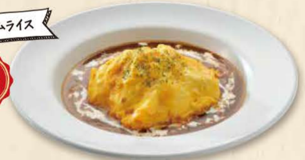
デミグラスオムライス