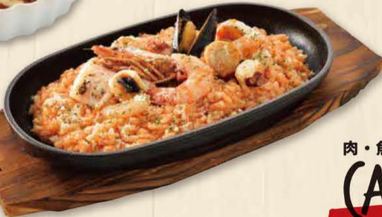
シーフードトマト 焼きリゾット