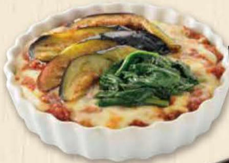
おすすめ 茄子とほうれん草の ミートソースドリア